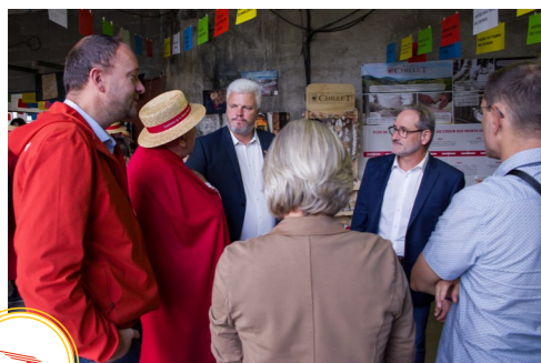
associations en charge de l'animation : la confrérie de la noble rosette et le groupe histoire et patrimoine