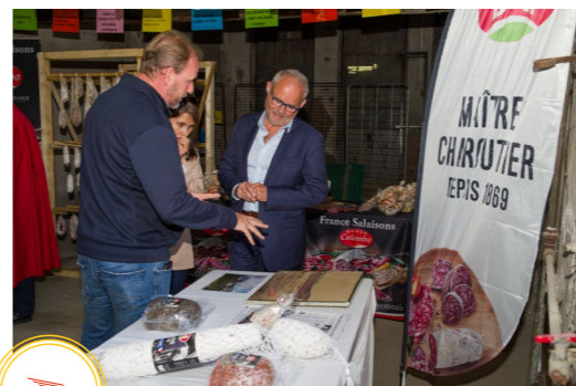
le public nombreux a défilé tout le week-end lors des animations et expos