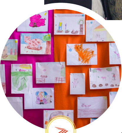
expo photos réalisées par les écoles et la médiathèque

Merci aux associations pélaudes (Maison des métiers et groupe histoire et patrimoine, médiathèque, confrérie de la noble rosette et du saucisson) de s'être engagées sur ce week-end autour de Journées Européennes du Patrimoine. Merci aux élus de