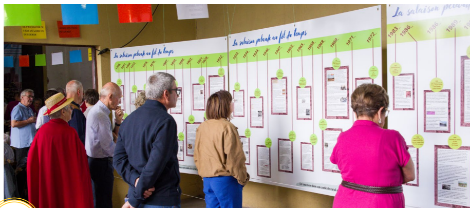
exposition créée et proposée par la Maison des Métiers, le groupe histoire et patrimoine